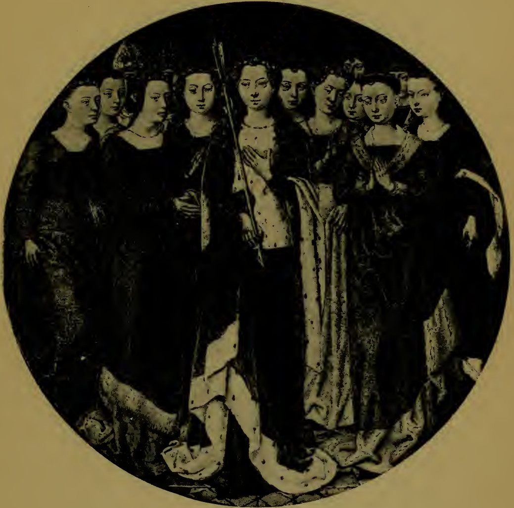
Sainte Ursule entourée de ses compagnes et des deux pontifes Martyrs faite de la Châsse de Sainte Ursule.